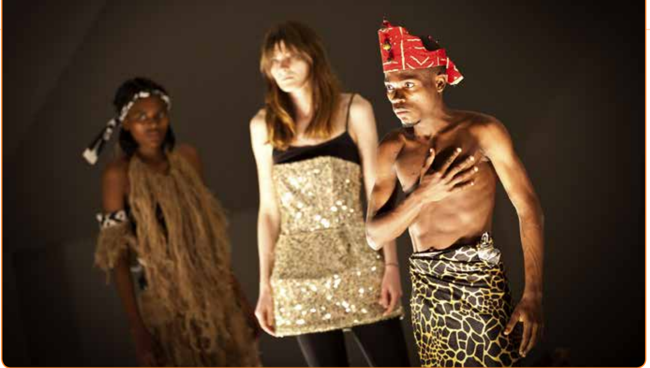
„Das Leben ist Traum/A vida e sonho“: Szene aus einem Theaterstück, das bei der weltwärts-Begegnung zwischen der JugendTheaterWerkstatt Spandau und dem Centro de Animação Artística do Cazenga /ANIM'ART (Luanda, Angola) entstanden ist

licht einerseits ganz neue Sichtweisen auf die globalen Themen und Herausforderungen, mit denen sich die jungen Menschen während ihres Begegnungsprogramms beschäftigen. Andererseits erleben die Teilnehmenden – egal ob Jugendliche oder Fachkräfte – eine intensive Begegnungssituation über Kontinente hinweg immer auch als einen Blick in den Spiegel. Denn in kaum einer anderen Lebenssituation wird man vom Gegenüber so nachdrücklich hinterfragt und hinterfragt daher auch sich selbst, den eigenen Lebensstil oder den eigenen oft eindimensionalen Blick auf die Welt und ihre Zusammenhänge.