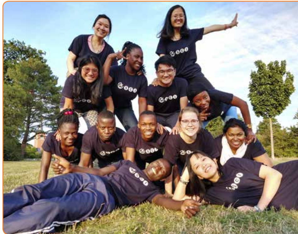
Teilnehmende des Freiwilligenprogramms

Menschen (fast) jeden Alters mit unterschiedlichen Vorerfahrungen und Hintergründen nehmen an unseren kurz-, mittel- und langfristigen Freiwilligeneinsätzen im In- und Ausland teil. Für alle Freiwilligen möchten wir eine gute pädagogische Begleitung sicherstellen. Dabei bewegen wir uns als internationale Friedens- und Freiwilligenorganisation in einem ständigen Spannungsfeld: Kann es trotz globaler Ungleichheiten, kolonialer Kontinuitäten und daraus resultierenden Bildern in den Köpfen überhaupt „Begegnung auf Augenhöhe“ geben? Was ist in Zeiten des Klimawandels unsere Position zu Flugreisen? Welches Maß an persönlichen Begegnungen ist im Sinne echter Partnerschaft und mit dem Ziel internationaler Verständigung dennoch unerlässlich? Und wie finden wir gemeinsame Lösungen in unserem weltweiten Netzwerk durch partnerschaftlichen Dialog, ohne dass eurozentristische oder neokoloniale Perspektiven dominieren oder die Verortung der Fördermittel im Globalen Norden Entscheidungsprozesse beeinflussen?