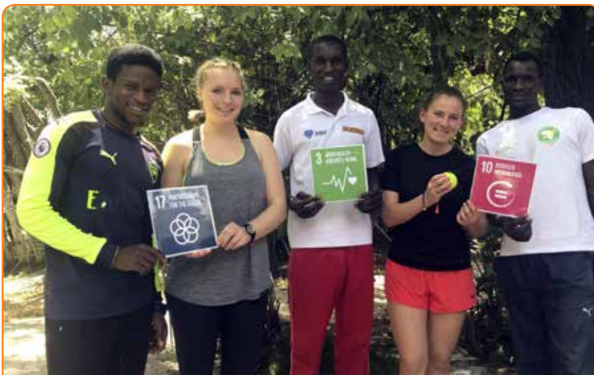
Die SDGs als Thema im Jugendaustausch

Als dsj sind wir angetreten, um durch Bildungsarbeit im und durch Sport einen Beitrag zur Entwicklungszusammenarbeit zu leisten. Dafür werden diverse Materialien, Beratung und Qualifizierung, Informations- und Partnermatching-Veranstaltungen und vieles mehr angeboten. Um daneben auch einen erhöhten Multiplikationseffekt zu erzielen und insbesondere junge Menschen zu erreichen, die künftig selbstständig eigene