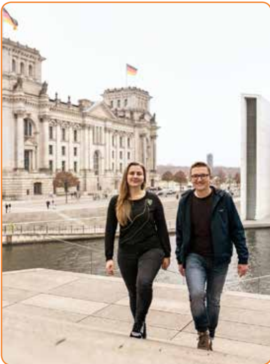
Fordern Einsatz für die SDGs: Die UN-Jugenddelegierten für Nachhaltige Entwicklung

W ir sind die Generation, die immer wieder als apolitisch, demokratie-müde und politikverdrossen bezeichnet wurde. Auch wenn dieses Bild noch nie stimmte, ist nun sichtbarer denn je, dass es unsere Generation ist, die verstanden hat: Wir können globale Probleme nicht weiter verdrängen und immer wieder auf die lange Bank schieben.