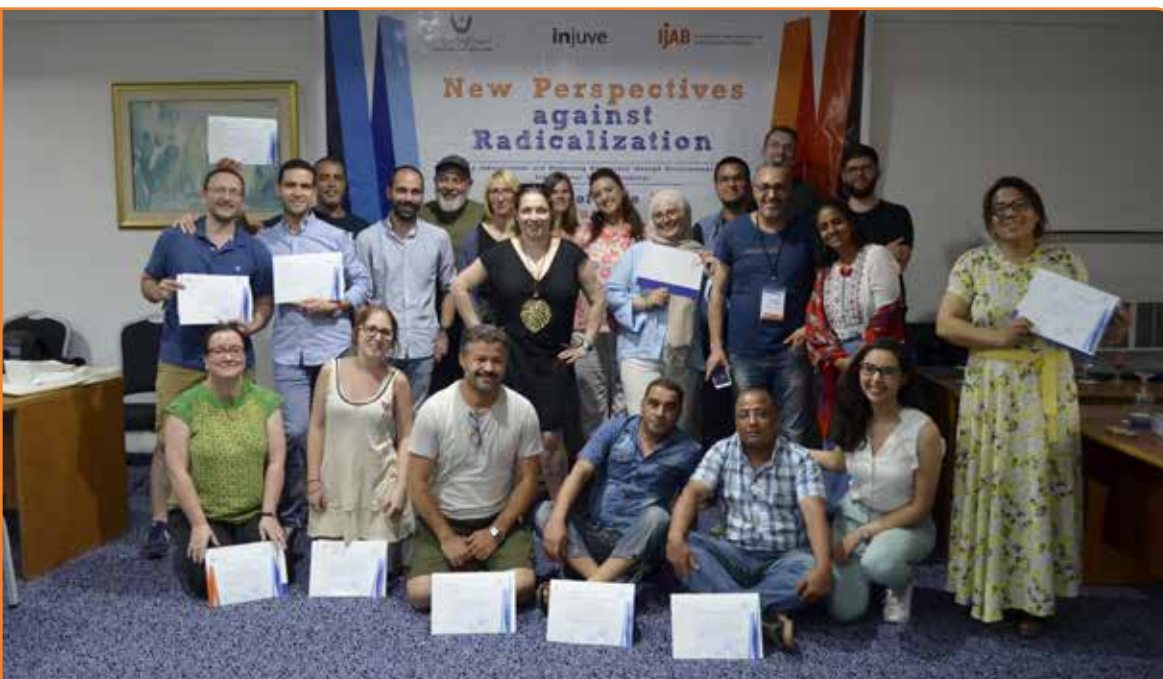
Die Teilnehmenden am Fach- austausch über Radikalisie- rungsprävention in Tunis vom 23. bis 27. September 2019